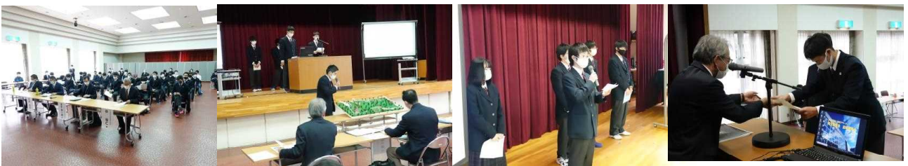
上にも記載した通りどの班も素晴らしいプレゼンでした！3班・5班は全道大会、代表として頑張れ！！