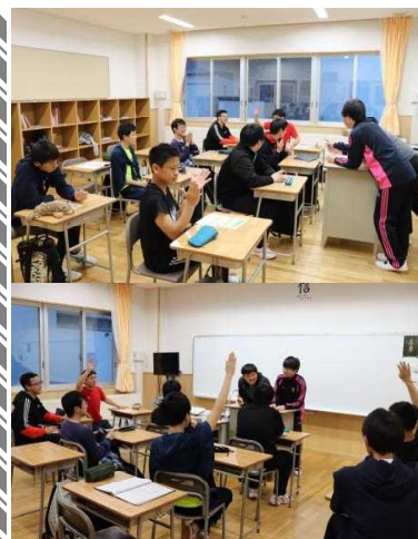
役員選出LHRの様子～ 皆、積極的に参加してくれました！

※昨日のLHRにて、上記メンバーに決定しました。 任期は半年。責任を持って各自つとめ上げて下さいね！