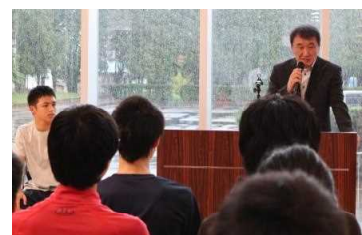
校長先生より本人の紹介