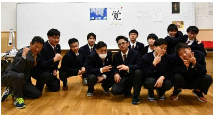
新生2学年始動(^_^)v 今年1年「阿修羅の如く」戦え!

この日高高校の評価や評判が今後高まっていくか否かは、「皆さん自身がいかに真剣かつ有意義な毎日を送り、いかに自分自身を高め、また仲間と高め合うか」にかかっているのだ と いうことを肝に銘じ、今年1年頑張ってみましょう!そして、始業式の際に述べた「町民の方々へのご挨拶」を爽やかに、よろしく!!!